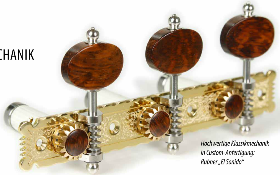
Hochwertige Klassikmechanik in Custom-Anfertigung: Rubner „El Sonido“

Zusammen mit dem Hersteller verlosen wir eine Rubner „El Sonido“-Klassik-Mechanik (das in diesem Testbericht vorgestellte Exemplar). Schreibt dazu eine E-Mail mit dem Betreff „Rubner-Mechanik“ an die Adresse redaktionsteam@akustik-gitarre.com und gebt eure Adresse an. Zuschriften ohne Adressangaben werden nicht berücksichtigt. Unter allen Einsendungen bis zum 28. Februar 2022 werden die Gewinner ausgelost. Viel Glück!